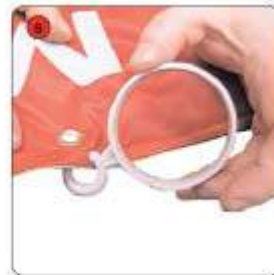
Accrocher les 7 grands anneaux sur le côté de la voile et les 4 petits sur le haut de cette même voile.