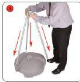
Placer les bras stabilisateurs sur les 3 trous du pied réservoir.