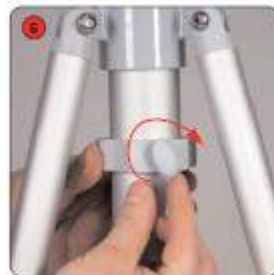
Placer le stop anneau prêt des bras stabilisateurs et resserrer la vis.