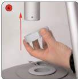
Positionner le stop anneau sur le mât télescopique avant d'emboîter ce dernier dans le pied.