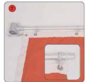
Enfiler les 4 petits anneaux sur le mât horizontal. S'assurer que les bagues en caoutchouc maintiennent les 2 anneaux aux extrémités du mât.