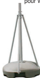
Réservoir 44L pour WinD Dancer 4m