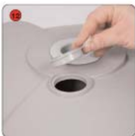
Retirer le capuchon du pied réservoir et le remplir d'eau.