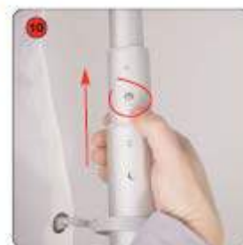
Déployer le mât télescopique à la hauteur souhaitée. S'assurer que chaque bouton est bien enclenché dans le mât.