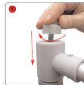
Attacher le mât horizontal au mât télescopique à l'aide de la vis fournie.