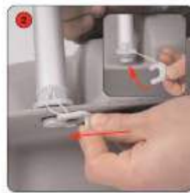
Fixer les bras stabilisateurs sous le pied à l'aide des encoches fournies