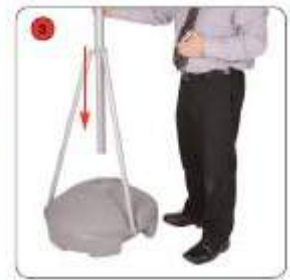
Faire coulisser le mât télescopique dans l'anneau central des bras stabilisateurs.