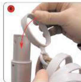
Enfiler les 7 grands anneaux sur le mât télescopique.