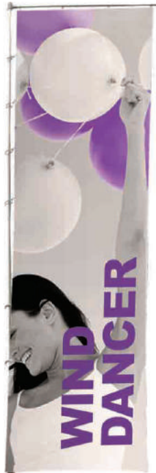
Wind Dancer 5m / 66L